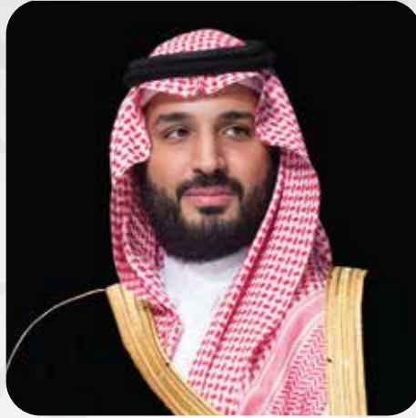
صاحب السمو الملكي الأمير محمد بن سلطان بن عبدالعزيز آل سعود ولي العهد نائب رئيس مجلس الوزراء وزير الدفاع

” لقد أولت حكومة خادم الحرمين الشريفين الاهتمام الكبير بالقطاع الثالث غير الربحي. والذي يتكون من الجمعيات، والهيئات الخيرية، والتعاونية وجعلت هذا القطاع ركيزة في رؤية 2030، واعتمدت عليه في تغيير وتطوير الدولة