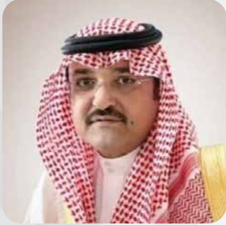
صاحب السمو الملكي الأمير مشعل بن ماجد محافظ جدة