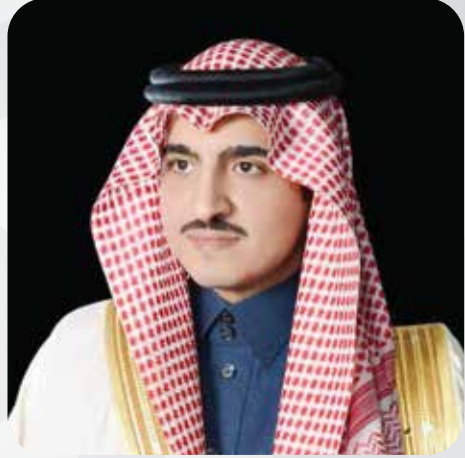
صاحب السمو الملكي الأمير بندر بن سلطان نائب أمير منطقة مكة المكرمة